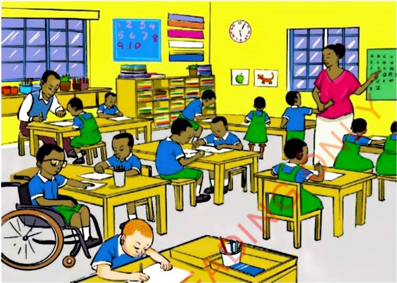
Kielelezo namba 1.1: Darasa jumuishi